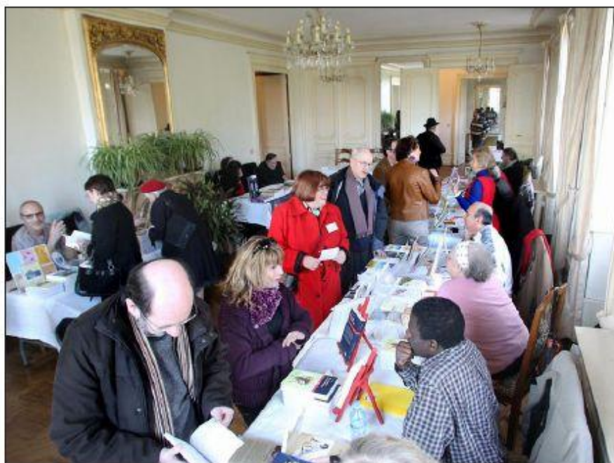
■ Le plaisir de rencontrer des écrivains du terroir...